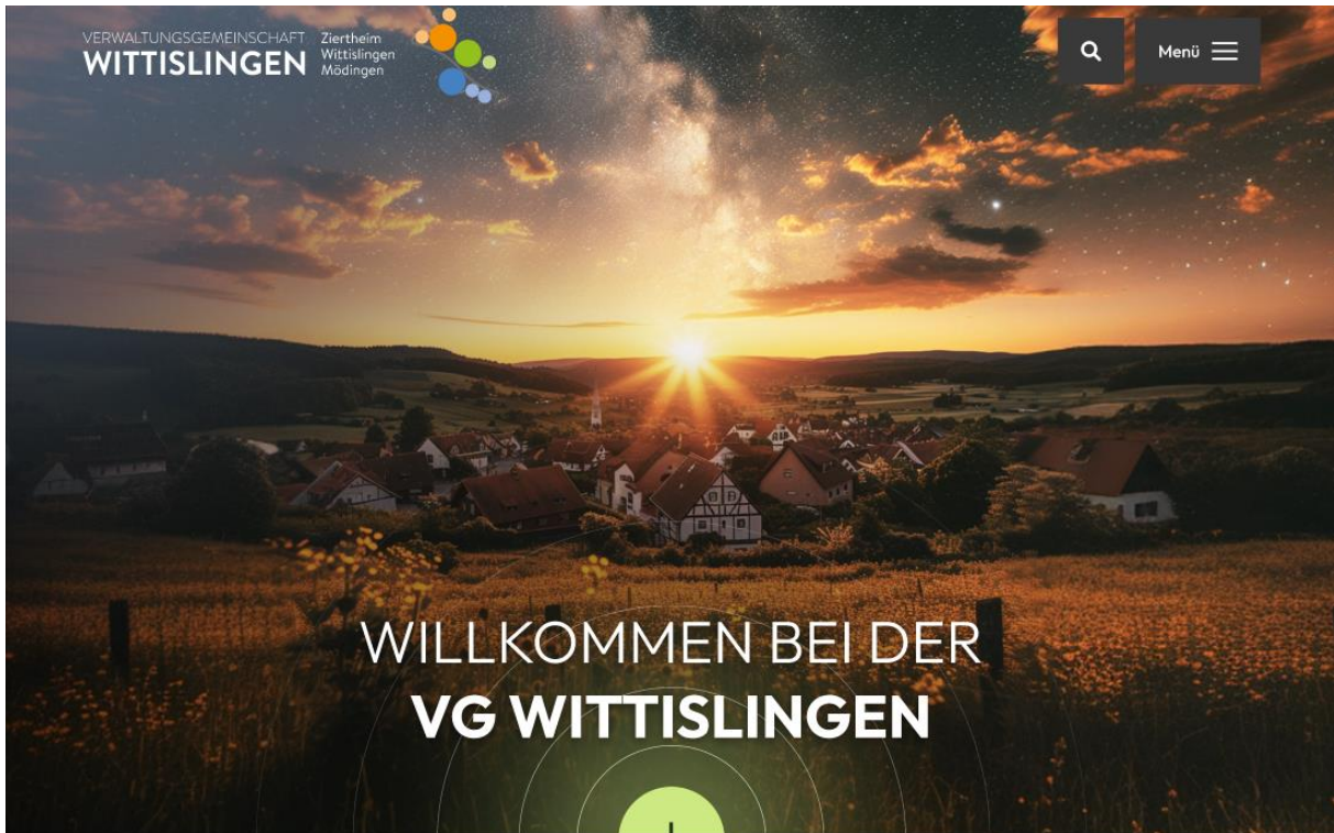
Entwurf Startseite neue Webseite